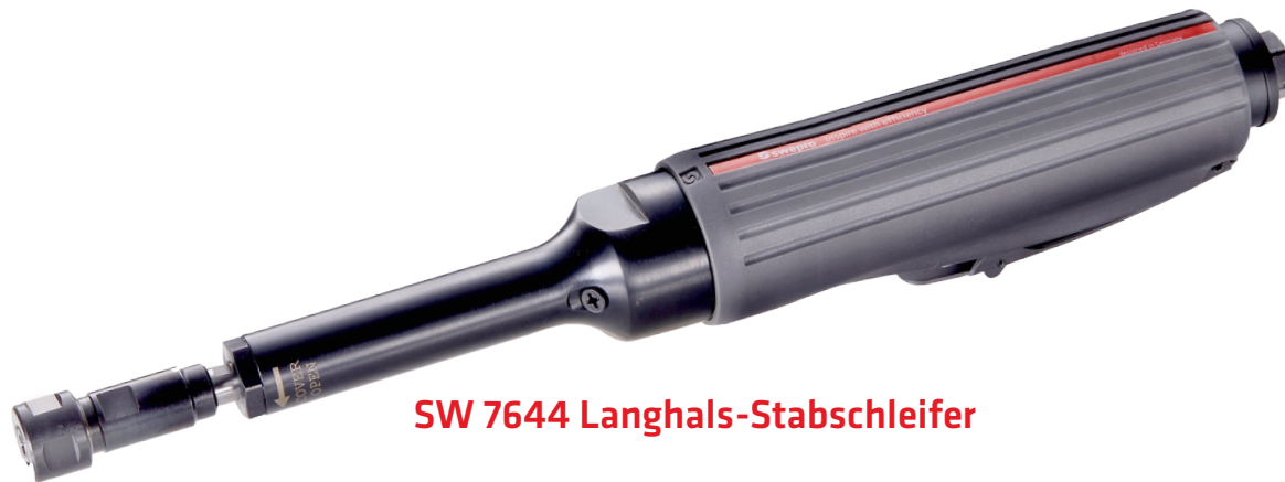
SW 7644 Langhals-Stabschleifer