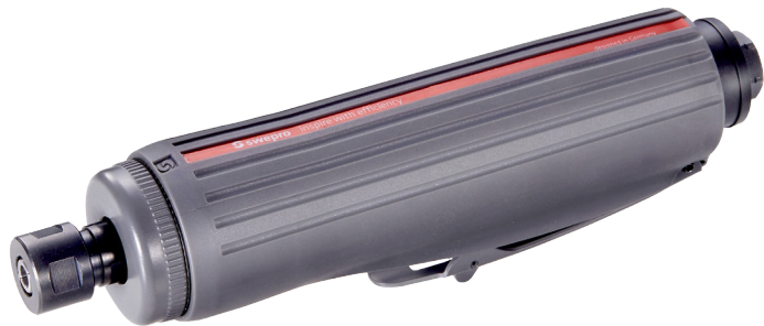
SW 7633 Stabschleifer