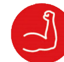
KRAFT Sehr stark