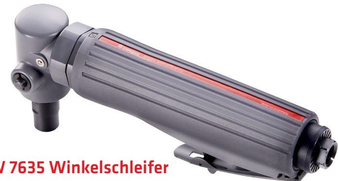
SW 7635 Winkelschleifer