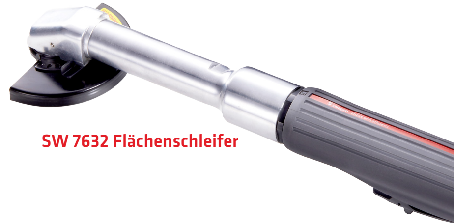
SW 7632 Flächenschleifer